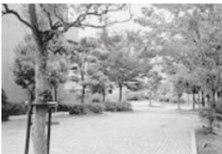
遊歩道（住宅敷地内）